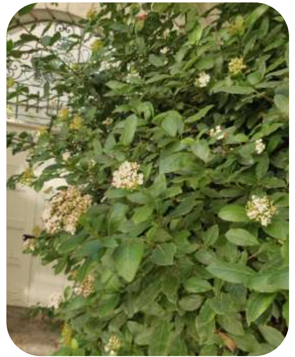
Photo générale du Viburnum tinus prise en mars