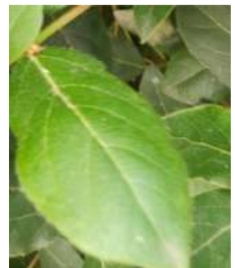
Photo de la feuille du Viburnum tinus prise en mars