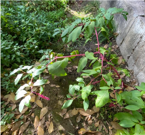
Silhouette Automne Strate Herbacée