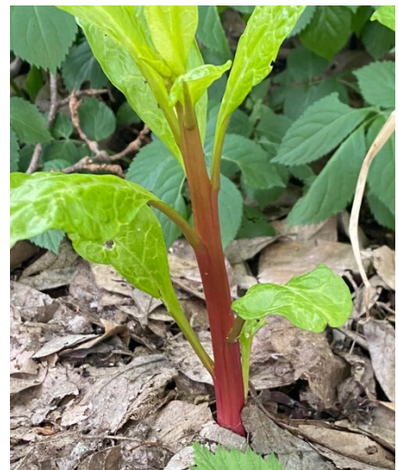
Tige Printemps Strate Herbacée