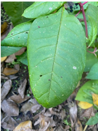
Feuille Automne Strate Herbacée

Une dizaine d'exemplaires sont présents dans la cours Jules Valles .